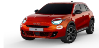
Sun of Italy