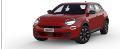
Red by (RED)