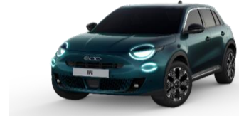
Sea of Italy