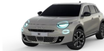
Earth of Italy