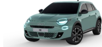
Sky of Italy