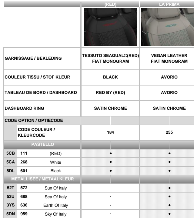
TABLE DES COULEURS & GARNISSAGES / KLEUREN- EN BEKLEDINGENTABEL